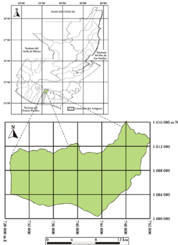
FIGURA 1. Mapa de Ubicación General del Área de Estudio, dentro de la cuenca del río Achiguate.

Hidrogeológicamente, sobre el sistema acuífero ubicado en el valle aluvial con un área de 30 km 2 , tienen influencia las regiones ubicadas en las faldas de los volcanes de Agua, que alcanza una elevación de 3 760 m.s.n.m. al sureste y Acatenango con 3 970 m.s.n.m. al suroeste, representando un potencial importante para la recarga al sistema acuífero presente en el valle (Velásquez, 1995). Por ello se consideró el área geográfica de influencia sobre el valle desde la Antigua Guatemala hasta Alotenango. El valle aluvial, se orienta en forma general de norte a sur, las partes planas presentan pendientes entre 0 a 4%, mientras que las laderas de las colinas y montañas que sobre él influyen presentan pendientes mayores del 50%.