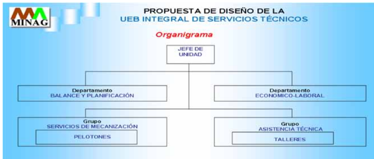
FIGURA 2. Organigrama de las Unidades.

Planificación. Comprende la programación de las actividades para los diferentes periodos agrotécnicos a partir de los balances realizados.