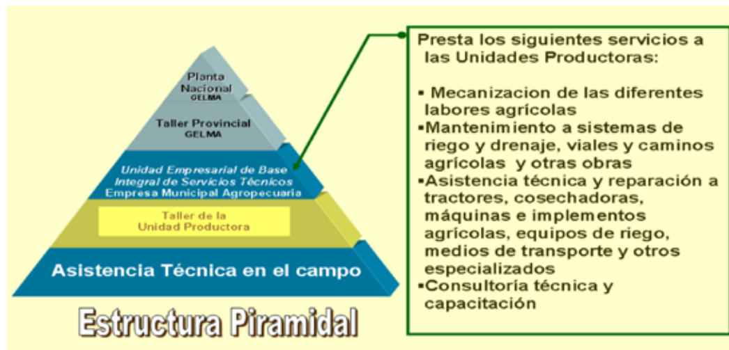
FIGURA 4. Posición de las Unidades Integrales de Servicios Técnicos, dentro del Sistema nacional de asistencia técnica.