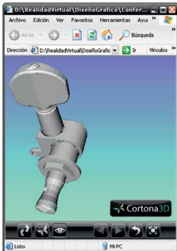
FIGURA 5. Mecanismo de un sistema CAD profesional en ambiente Web.