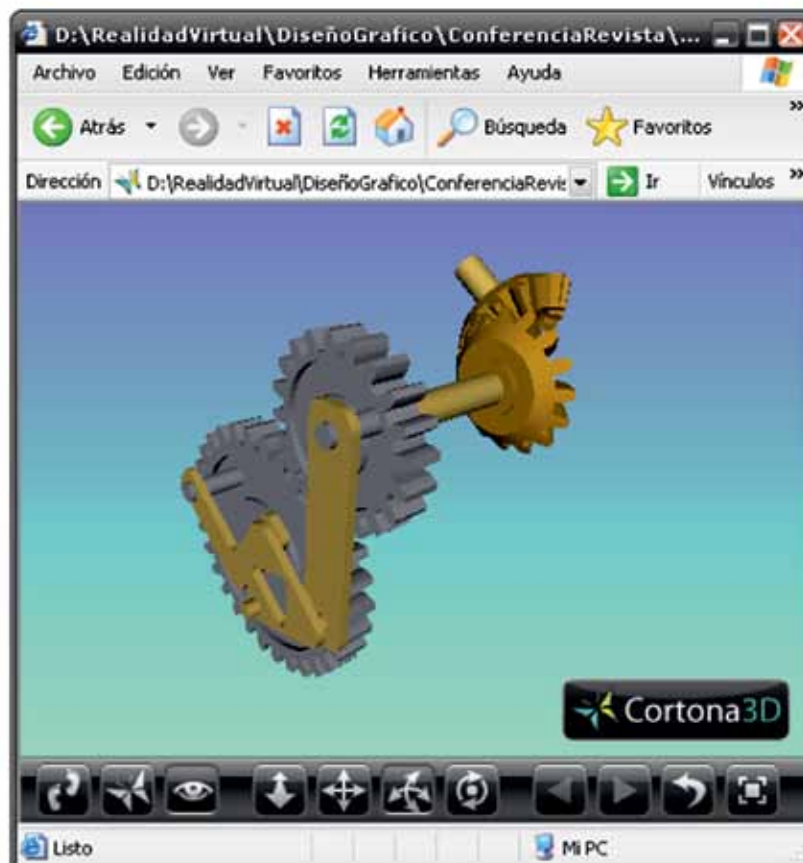
FIGURA 2. Mecanismo de ejemplo de un sistema CAD profesional en ambiente Web.