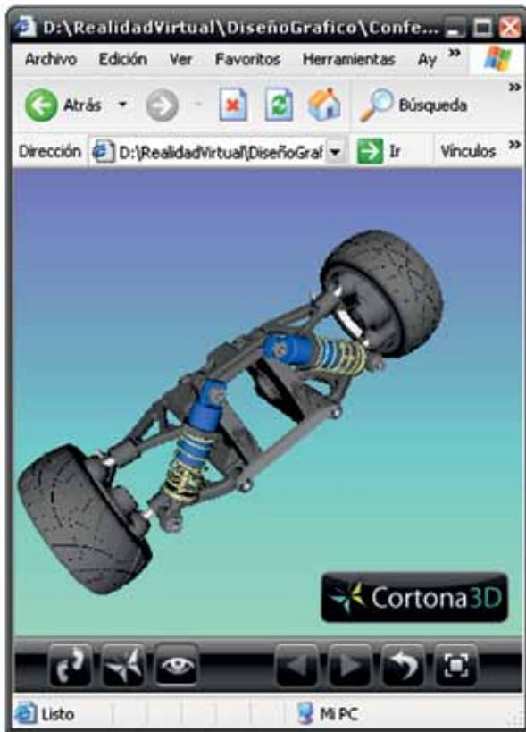
FIGURA 3. Mecanismo de ejemplo de un sistema CAD profesional en ambiente Web.