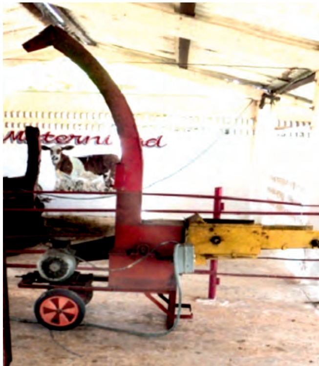
FIGURA 1. Picadora de forraje MF IIMA modelo EM-01 perfeccionada.

con motor eléctrico de 7,5 kW (Figura 1), durante el suministro del forraje fresco desmenuzado a partir de la caña de azúcar, a un grupo de 15 vacas lecheras. La toma de los datos experimentales se realizó diariamente durante 35 días entre los meses de febrero y marzo de 2013, bajo las siguientes condiciones climatológicas: humedad relativa 72,83%, temperatura 25,7°C, índice de precipitaciones 16,76 mm, presión atmosférica 1 015 hPa y velocidad del viento 5,4 m/s.