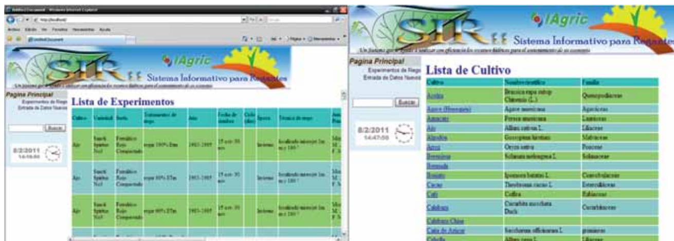
FIGURA 1. Herramienta SIR 1.1, Sistema Informativo para Regantes. Listado de todos los experimentos y Tabla con el nombre científico y la familia de 56 cultivos.

cliente, basado en la búsqueda de información contenida en diversas tablas de datos asociados. Está diseñada en DELPHI 6, y puede ser instalada en los sistemas operativos que cuenten con la tecnología NT, corre sobre 32 MBytes de RAM y solo necesita 5 MBytes de espacio en disco duro para los sistemas básicos sin contar el espacio de las bases de datos. (Figura 1)