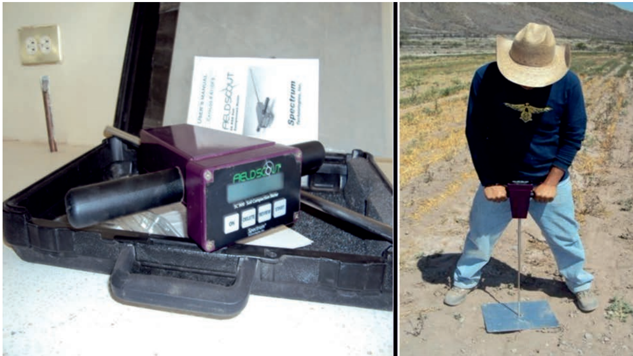
FIGURA 1. Penetrómetro digital FIELDSCOUT SC 900.