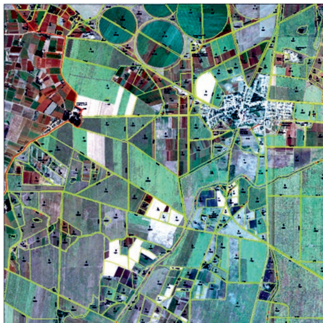
FIGURA 1. Trazado de polígonos para el trabajo de la maquinaria agrícola usando imágenes de Google Earth de la Empresa de Cultivos varios de Guines.

Evaluación y monitoreo de terrenos labrados por la maquinaria agrícola: Las imágenes de satélites de alta resolución espacial (Sot-XS, Google Earth, IKONOS, QuickBird, y otras) son ideales para captar las áreas de terreno que han sido preparadas por la maquinaria agrícola. Luego estas imágenes pueden constituir una especie de "línea base" para realizar estudios posteriores comparativos sobre el cambio de uso y cobertura de la tierra (Figura 1).