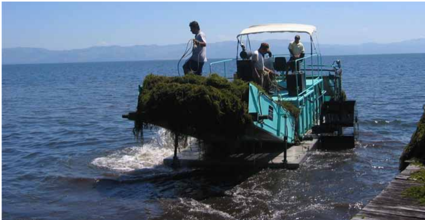
FIGURA 1. Extracción de Hydrilla verticillata del lago Izabal.

El alto nivel de extracción y deposición de residuos de esta planta a orillas del lago, la hace hospederio favorito para la reproducción de moscas y zancudos (mosquitos), así como la emanación de malos olores, contaminado en gran medida el medio y afectando el turismo tanto nacional como internacional.