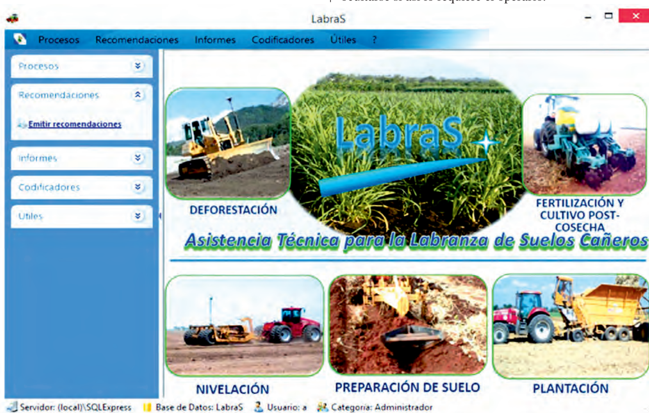
FIGURE 1. LabraS software environment. FIGURA 1. Entorno del software LabraS.

El entorno del software se muestra en la Figura 1. Los principales menús que componen la aplicación son: Procesos, Recomendaciones, Informes, Codificadores y Útiles , ubicados en la parte superior o lateral izquierdo para facilitarla interactividad con el usuario. El menú lateral está diseñado para ocultarse si así lo requiere el operario.