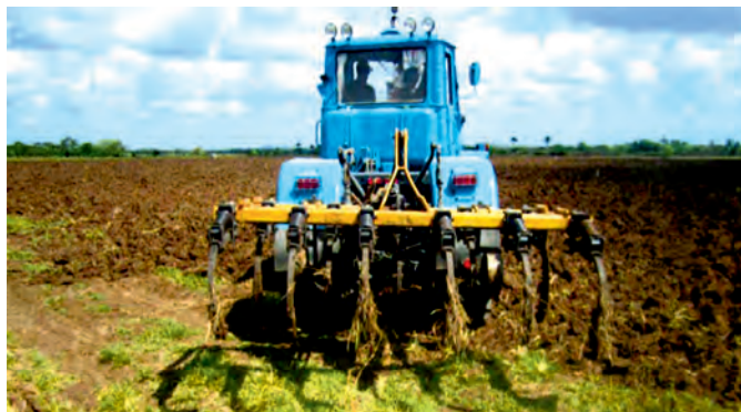
Figura 1. Tractor XTZ-150K-09 acoplado a un tiller de profundidad media de 11 órganos CHR-11P.

La investigación se realizó en las áreas agrícolas de la Empresa Agropecuaria Valle del Yabú, en Villa Clara, durante el año 2014. Para la investigación se utilizaron tres tractores de los cuatro disponibles en la empresa. La información inicial se obtuvo en correspondencia con los procedimientos descritos en la NC 34-37: 2003, es decir, se elaboraron cronocartas para registrar los tiempos fundamentales que influyen en la jornada laboral de los tractores en estudio, agregados al arado AT 90, la grada de 2199 kg GRSV 24/24 y el tiller CHR 11P (Figura 1).