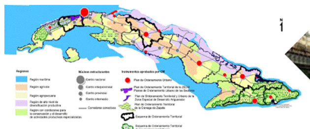
Figura 1. Política urbana. INOTU, 2021.

hacer ciudades y asentamientos humanos inclusivos, seguros, resilientes y sostenibles INOTU (2021), la cual deviene política urbana a nivel local, cuya implementación realizan los actores y gestores municipales (Figura 1).