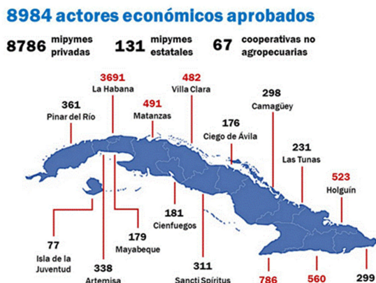
Figura 2. Actores económicos en Cuba al cierre del 2023.

A decir de Fernández et al. (2023) la adecuada selección de las personas que pueden desempeñarse como intendentes, y en general de los funcionarios públicos merece mayor atención en la gestión del desarrollo local. Por lo cual, estos autores, enfatizan en la creación de capacidades a ese nivel. Consideran también necesario avanzar en la implicación del conjunto de actores que operan en los municipios, comunidades y consejos populares. Así como, multiplicar los procesos de formación, según las particularidades y potencialidades territoriales, tanto de actores como de gestores ( Figura 2 ).