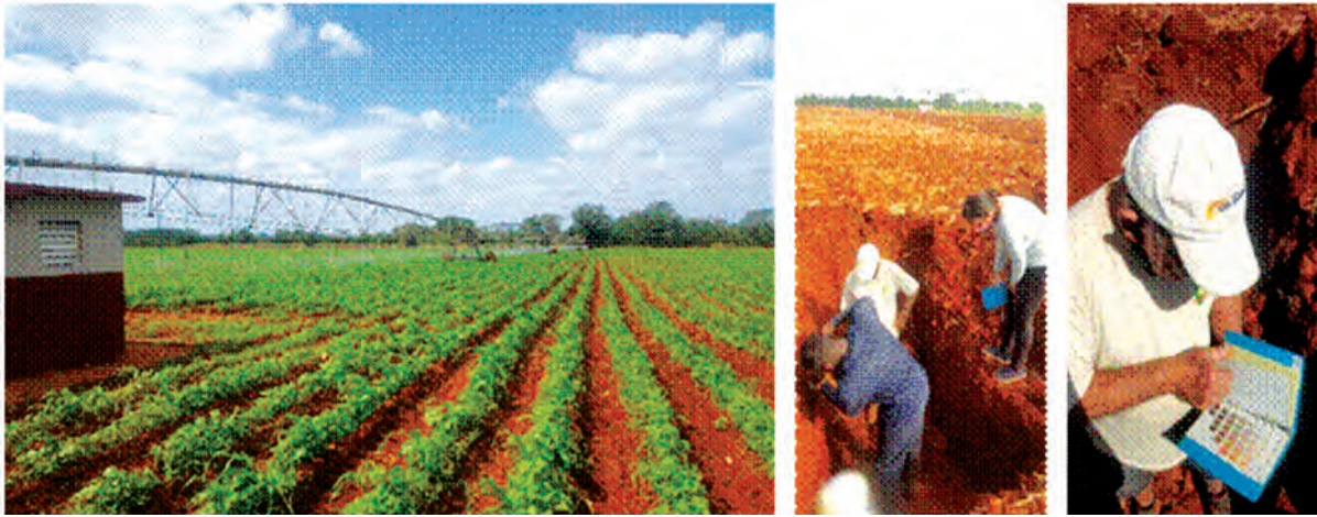
FIGURA 3. Estación Experimental “Pulido”. Área de siembra mecanizada frijol-maíz. Municipio Alquízar, provincia Artemisa.

En cada uno de ellos se realizó la excavación de una microcalicata ( \approx 50 cm) para evaluar las propiedades macromorfológicas (color, estructura, textura), mediante observación y comparación con la Tabla Munsell® y método organoléptico. Se tomaron muestras no perturbadas para humedad NC: 110: (2010), densidad aparente ISO 11272: (2017), porosidad total, capilar y de aireación NC: 1045: (2014) y muestras perturbadas para determinar materia orgánica (NC: 51: (1999), composición mecánica (Bouyucos) y porcentaje de agregación (NC 1044: 2014).