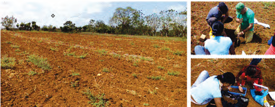
FIGURA 1. Finca “El Mamey”. Área de siembra de gladiolo ( Gladiolus hybridus ). Municipio San José de las Lajas, provincia Mayabeque.

El trabajo fue realizado en dos localidades: i) la Finca “El Mamey” (municipio San José de las Lajas, Provincia Mayabeque) y ii) la Estación Experimental del Instituto de Ingeniería Agrícola (Iagric) “Pulido” (municipio Alquizar, Provincia Artemisa). La primera de ellas, está dedicada a cultivos de hortalizas, viandas y flores, mientras que la segunda posee áreas con cultivo de maíz ( Zea mays ) y frijol ( Phaseolus vulgaris ), y manejo agroforestal con cedro ( Cedrela odorata ) y café ( Coffea arabica ). Ambos suelos corresponden a la llanura Habana–Matanzas, de origen cársico, con clima tropical subhúmedo (Figuras 1, 2 y 3).