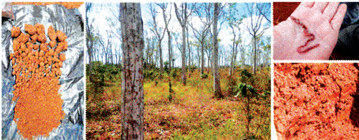
FIGURA 2. Estación Experimental “Pulido”. Área bajo manejo agroforestal ( Cedrela odorata y Coffea arabica ). Municipio Alquizar, provincia Artemisa.

En el primer caso, se escogieron cinco puntos de muestreo en función de la topografía del terreno, que presenta dos pendientes ligeras (5% y 8%). En el segundo, se realizó la evaluación en dos áreas con usos contrastantes: un área bajo manejo agroforestal (cedro y café) y otra con siembra mecanizada de maíz y frijol.