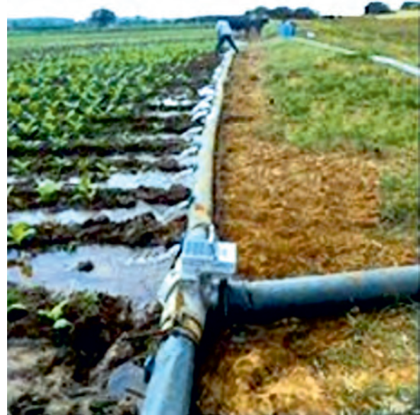
FIGURA 3. Disposición de las compuertas y válvula de control en el campo de tabaco.