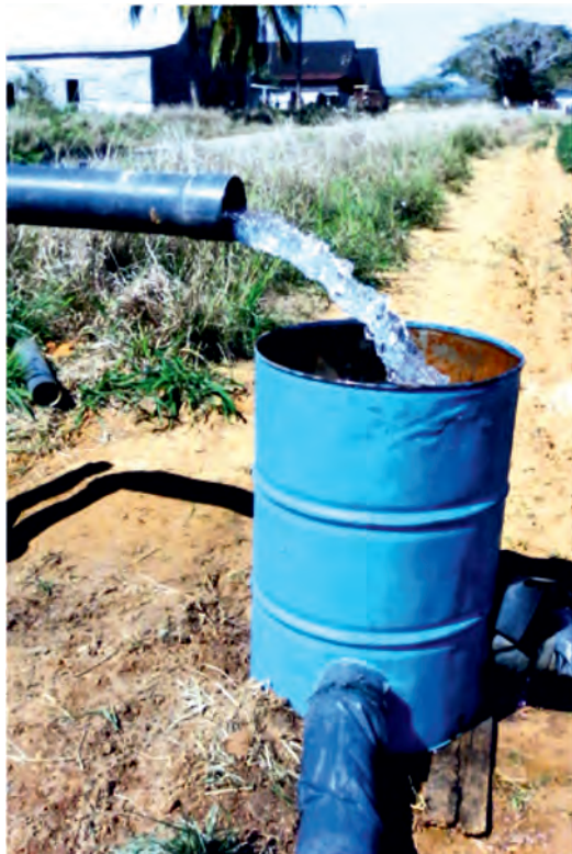
FIGURA 2. Hidrante de salida al campo y tanque amortiguador con conexión de las mangas de polietileno.